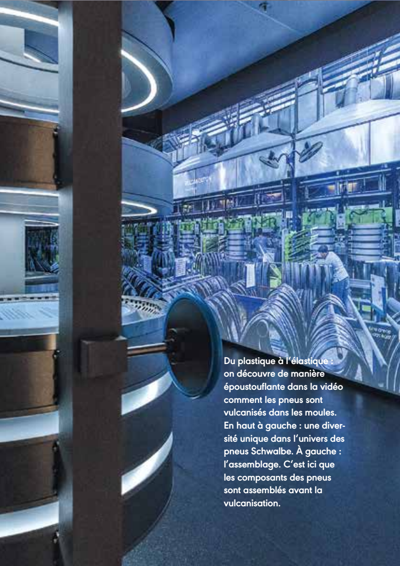
Du plastique à l'élastique : on découvre de manière époustouflante dans la vidéo comment les pneus sont vulcanisés dans les moules. En haut à gauche : une diversité unique dans l'univers des pneus Schwalbe. À gauche : l'assemblage. C'est ici que les composants des pneus sont assemblés avant la vulcanisation.