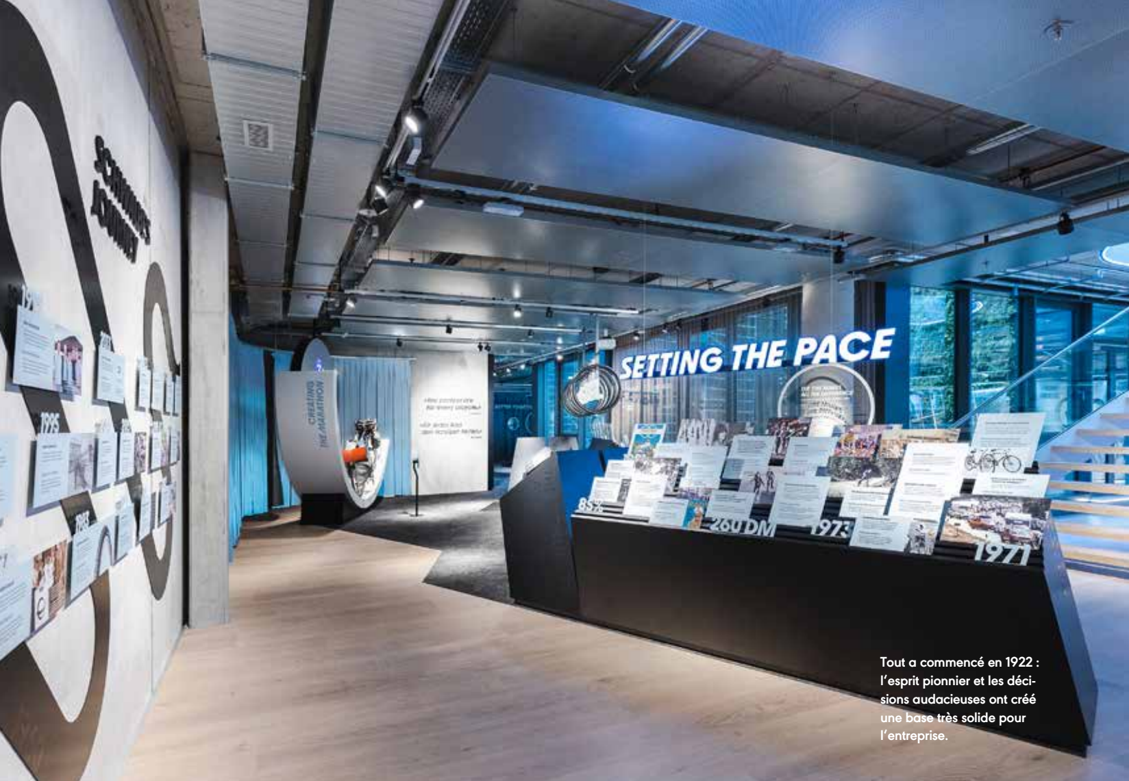
Tout a commencé en 1922 : l'esprit pionnier et les décisions audacieuses ont créé une base très solide pour l'entreprise.