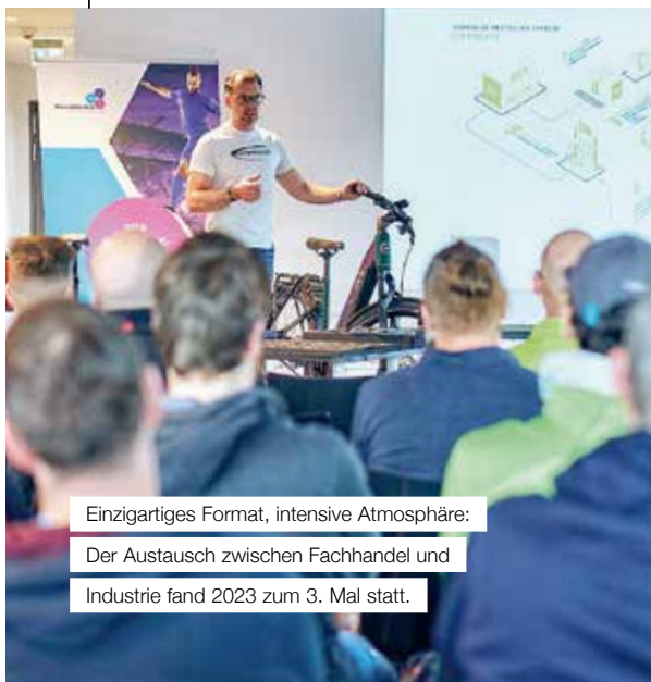
Einzigartiges Format, intensive Atmosphäre: Der Austausch zwischen Fachhandel und Industrie fand 2023 zum 3. Mal statt.