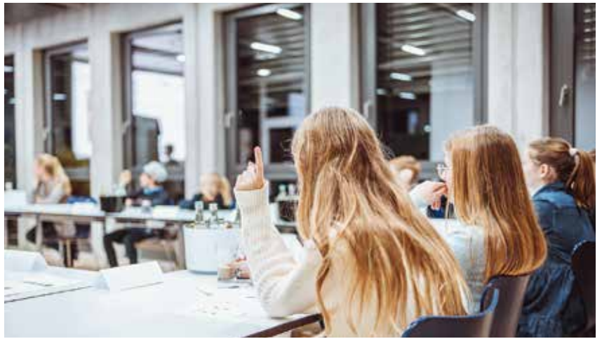
Kinder an die Macht: Der neue Schwalbe-Kinderbeirat entscheidet, welche Projekte unterstützt werden.

Zum Engagement gehören auch Hilfsprojekte in den Produktionsländern, darunter seit vielen Jahren die Unterstützung der Borneo Orang-Utan Survival Foundation (BOS), sowie Spenden an World Bicycle Relief