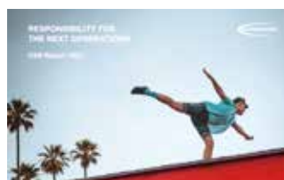
Der Schwalbe CSR-Bericht zum Download. www.schwalbe.com/nachhaltigkeit/csr-bericht-2021

Zusätzlich zu den sozialen Projekten setzt sich das Unternehmen ehrgeizige Ziele in seiner Nachhaltigkeitsstrategie. Höchstes Ziel ist die Kreislauf-