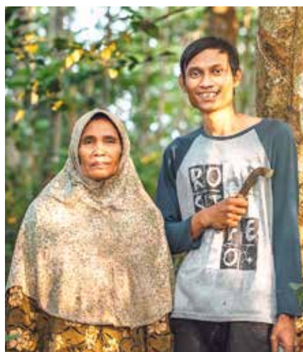
Un numero sempre maggiore di coltivatori di gomma, qui madre e figlio, appartiene alla cooperativa Fair Rubber.

100 per cento, è possibile solo una crescita costante e non a singhiozzo", spiega Felix Jahn. Per la produzione del Marathon E-Plus, del Marathon Plus Wheelchair e del Pick-Up Schwalbe, viene già utilizzato il caucciù proveniente da Fair Rubber. Nel 2023 ad Eurobike sarà presentata una ulteriore pietra miliare: un nuovo pneumatico realizzato in caucciù proveniente dal commercio equo-solidale!