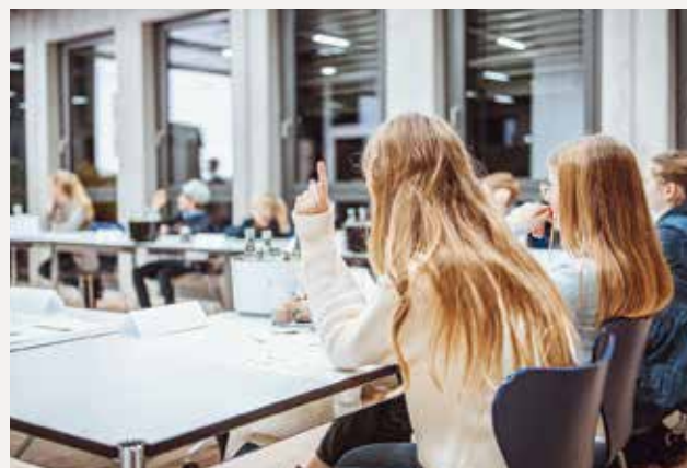
Il Consiglio Consultivo per l'infanzia di Schwalbe determina i progetti da finanziare.

Ogni anno, Schwalbe sostiene circa 50 progetti di aiuto, tra cui molti per i bambini. Il Consiglio Consultivo dei Bambini Schwalbe, di recente costituzione, decide quali di questi vengono selezionati per il finanziamento. 13 bambini, figli di dipendenti Schwalbe, di età compresa tra gli 8 e i 18 anni hanno votato per il 2023: coperte invernali per i bambini di Kharkiv (tramite una associazione di beneficenza), una officina per la realizzazione di biciclette in Burkina Faso e biciclette da corsa per un centro per famiglie a Gummersbach, dove ha la sede Schwalbe in Germania. Tutti i progetti hanno una cosa in comune: dare ad altri bambini una visione più fiduciosa del futuro. Il Consiglio Consultivo si riunisce due volte l'anno per discutere le richieste di finanziamento dei progetti e decidere su un budget di 20.000 euro.